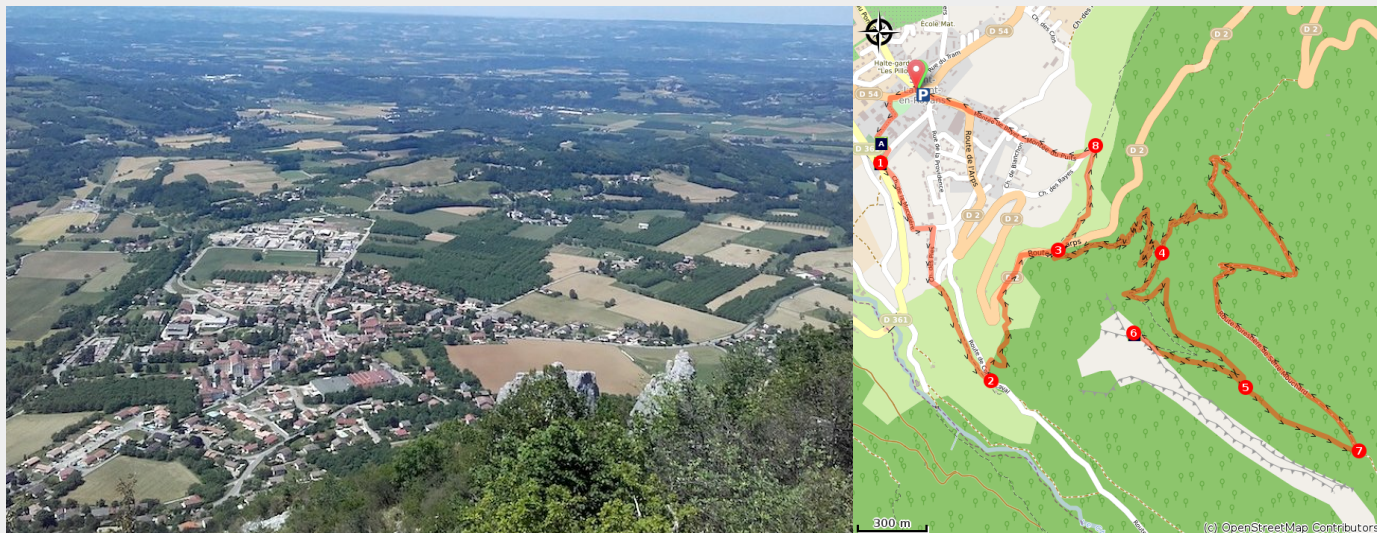
Vue sur Saint-Laurent et le Royans (S. Bossand)

Cette randonnée vous fait découvrir les principales richesses du patrimoine naturel et culturel de Saint-Laurent-en-Royans.